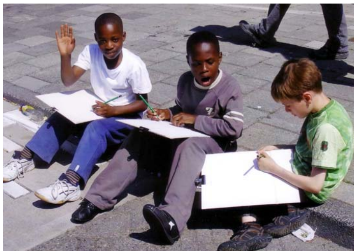
Prof. Dr. J.J. Dumontschool