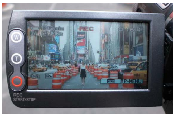
Theaterproject in New York van het Montessori Lyceum Amsterdam