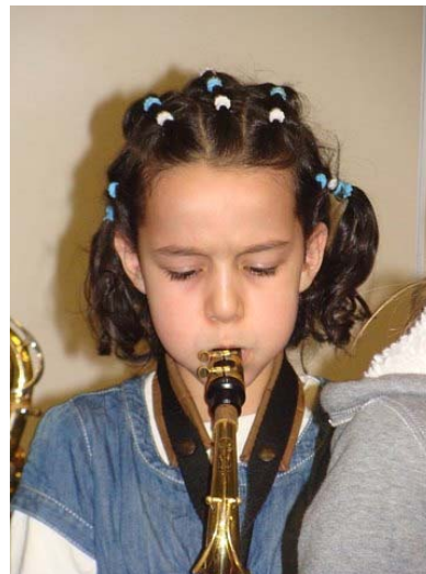
Leerling 't Koggeschip