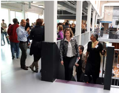
Cultuureducatie in Amsterdam 2010

Het blijft spannend, zes maanden lang. Je prikt een datum, 14 april, bedenkt een programma, benadert sprekers, kiest een locatie en stuurt een vooraankondiging uit. En dan komen de vragen: Hoe zorgen we voor contactmomenten tussen culturele instellingen en scholen? Vinden ze de netwerkluunch een goed idee? De