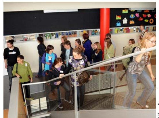
Cultuureducatie in Amsterdam 2010