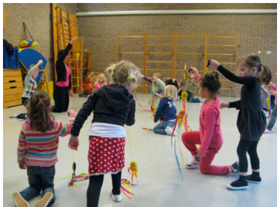
Kleuters op de Wespennestschool

Dans doet bewegen. Het zelfvertrouwen van leerlingen groeit door ze met elkaar, voor elkaar en voor anderen te laten dansen. Dans is 'uit je hoofd en in je lijf', een welkome afwisseling van de dagelijkse 'leer'-praktijk. Geen wonder dat docenten, leerlingen en ouders enthousiast zijn.