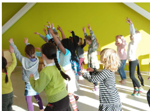
Laterna Magica, De katten rekken zich uit

Vaak worden de danslessen gekoppeld aan thema's die op school worden behandeld. Woorden uit de taallessen worden uitgebeeld in dans. Begrippen uit wereldoriëntatie of rekenlessen worden in dansoefeningen behandeld. Is het