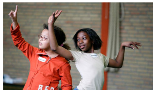
Dans in school

Op 8 VO-scholen in Amsterdam staat dans op het rooster Op 5 daarvan wordt dans alleen in de onderbouw gegeven Op 3 scholen is dans een eindexamenvak