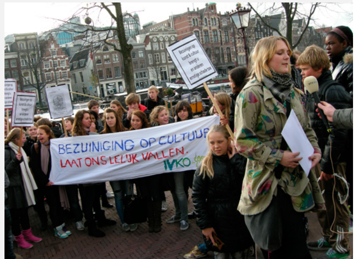
IVKO angry flashmob

Op 22 november heeft de IVKO met alle leerlingen een angry flashmob gehouden onder het motto: 'Bezuiniging op cultuur laat ons lelijk vallen'. De Amsterdamse wethouder kunst en cultuur Carolien Gehrels heeft de IVKO-petitie in ontvangst genomen. RTV-Noord-Holland en AT5 waren erbij. Zie: www.at5.nl/tv/at5-nieuws/aflevering/6752 en www.rtvnh.nl/uitzending-gemist/tv/6/5823/NH+Nieuws+en+Weer