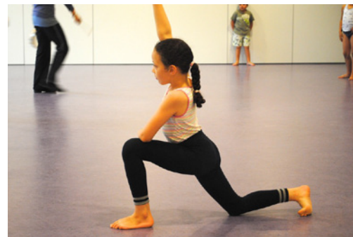
Dansles op De Kraal

woord 'diagonaal' niet meteen duidelijk in de rekenles? In de dansles krijgt het betekenis. Blijven woorden als 'verdrietig' en 'kwaad' nog vaak verbonden met verhalen of voorbeelden; de danser ervaart ze fysiek. Op die manier kan dans ook bijdragen aan het versterken van sociaal-emotionele vaardigheden. Berend en Ramon (groep