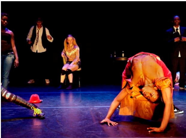
Dissbalance van Solid Ground Movement

Dans is schoonheid, dans is subtiel, dans is ontroerend, dans is emotioneel, dans is jezelf laten zien, dans is niet praten, dans is gewoon... dans. Dansen is bovendien ontspannend, dansen doet lachen, dansen is interactie, dansen is trainen. Maar wat zijn effecten van dans op leerlingen, jong en oud?