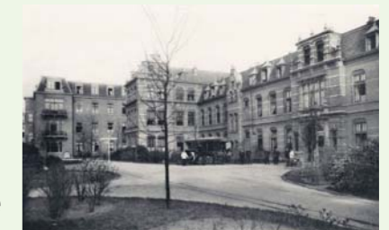
Kruising Pesthuislaan en Ite Boeremastraat