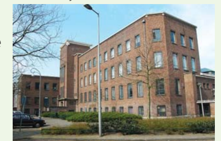
SMART/ PAL 2008