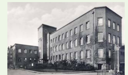
PAL: Pathologisch Anatomisch Laboratorium ca. 1950

En als je dat doet, vind je cultuur op iedere plek in deze stad. Kijk om je heen naar de gebouwen, leer hun geschiedenis en praat met kunstenaars en culturele instellingen in je eigen buurt.